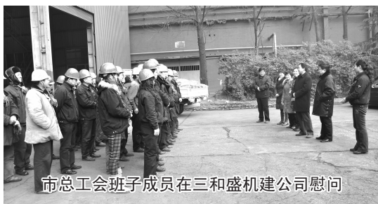
市总工会班子成员在三和盛机建公司慰问