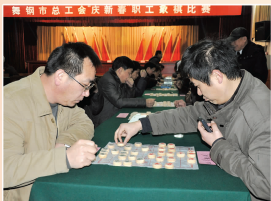
市总工会庆新春职工象棋比赛