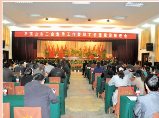
平顶山工会宣传工作暨职工书屋建设推进会在舞召开