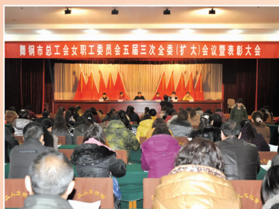
市总工会女职工委员会五届三次全委（扩大）会议暨表彰大会