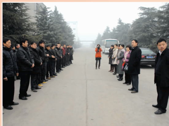
市总工会班子成员到海明集团送温暖