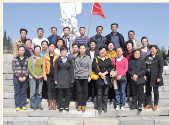
清明时节市总干部职工到虎头山烈士陵园扫墓