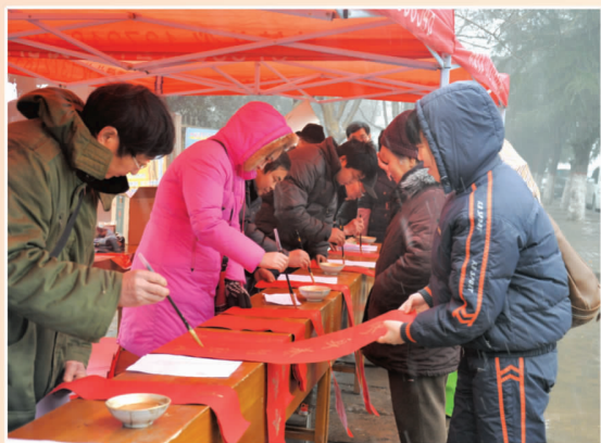
义写春联活动现场