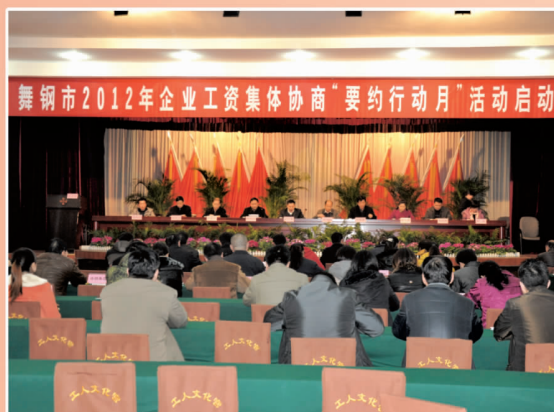
市企业工资集体协商“要约行动月”活动启动仪式