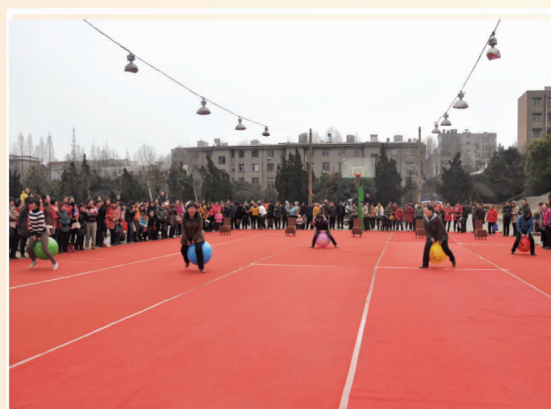
市总工会庆“三八”女职工趣味运动会